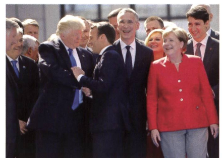
Trump schüttelt Macron die Hand, rechts Stoltenberg, Merkel, Trudeau.