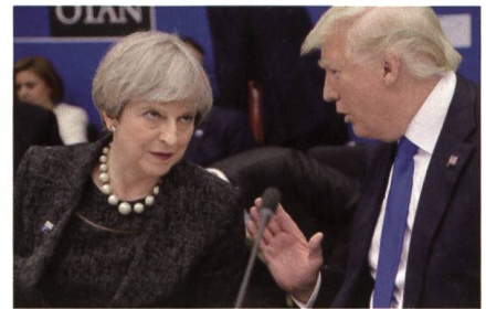
Beileid für Premier Theresa May.