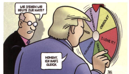
Noch immer verwirrt Trump die Partner. «Wie stehen Sie heute zur NATO». Trump: «Moment, ich hab's gleich».