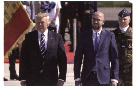
Mit Belgiens Premier Charles Michel.