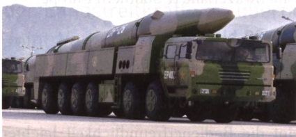
Mobiler Antischiff-Flugkörper DF-26.

China hat seine Anti-Schiff-Rakete Dong Feng-26 (DF-26), welche seit 2015 einsatzbereit ist und als «Guam-Killer» bezeichnet wird, erneut getestet. Das mobile Raketensystem mit einer Reichweite von 4 bis 5000 Kilometern kann mit einem konventionellen oder nuklearen Gefechtskopf