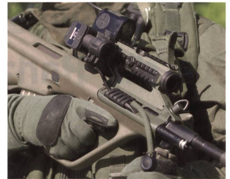
Laser-Licht-Module von Rheinmetall.

Polizeiliche und militärische Spezialkräfte aus Österreich nutzen weiterhin Laser-Licht-Module von Rheinmetall an ihren