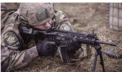
Erste Sturmgewehre des Typ HK416F.

Im Mai hat die französische Beschaffungsbehörde DGA ein erstes Los von 400 HK416 F vom Hersteller Heckler&Koch übernommen. Das HK416 F soll das Sturmgewehr FAMAS ersetzen. In den nächsten zehn Jahren sollen insgesamt 100 000 Gewehre (54 575 mit kurzem Lauf, 38 505 mit langem Lauf für das Heer) einschliesslich Zubehör sowie Ausbildung und logistischer Unterstützung in der Anfangsphase geliefert werden. Das F steht für FOT (force operationelle terrestre). Das HK416 F wird im NATO-Kaliber 5.56 × 45 mm in Frankreich und Deutschland produziert. Das Sturmgewehr kann Ge-