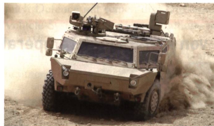
Zusätzliche Fennek JFST.

Das Gesamtvolumen beträgt rund 88 Mio. EUR. Die Fennek-Spähwagen werden zwischen 2018 und 2022 in die Va-