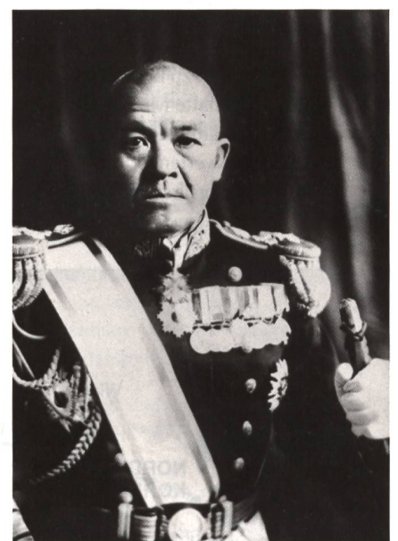
Vizeadmiral Naguma führte die japanischen Träger in die Midway-Schlacht.