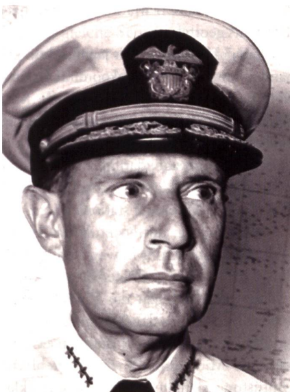
Konteradmiral und später Admiral Raymond Spruance, Kommandant der Task Force 16 in der Seeschlacht von Midway.

Die nachgeführten Schlachtschiffe sollten dann die amerikanischen Schlachtschiffe versenken. Vorgesehen war ferner,