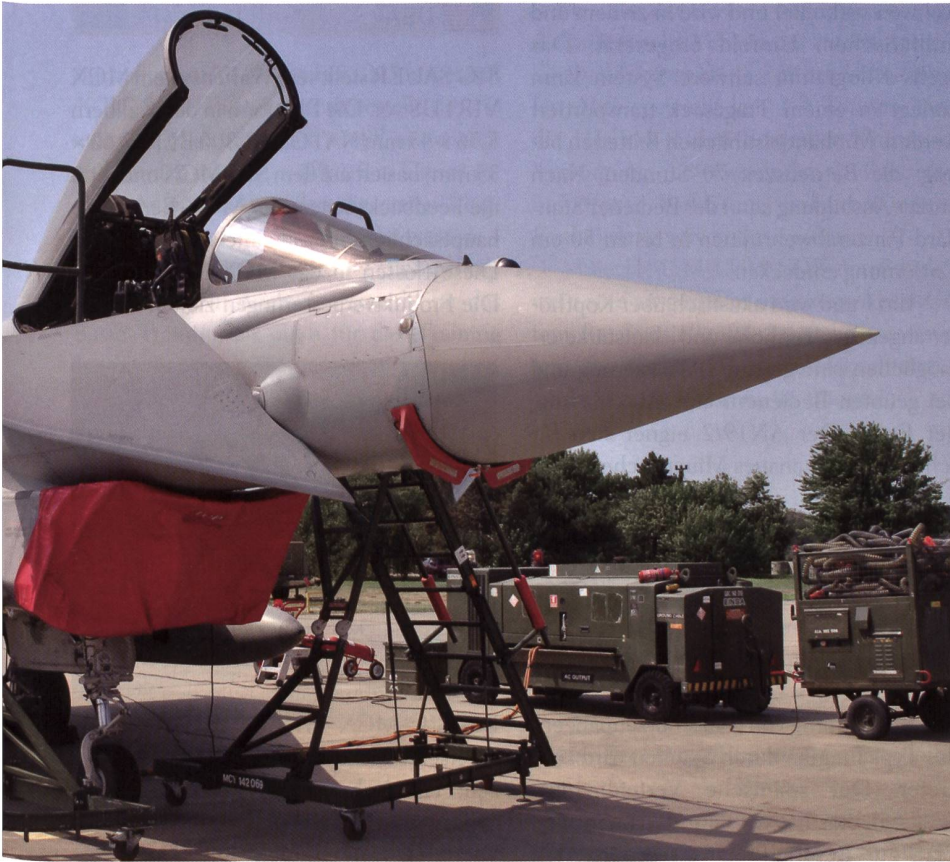
Typhoon der RAF wurden mit der Tranche 1 produziert und inzwischen laufend verbessert.

grössere und kleinere Fahrzeuge neuer Bauart der US-Armee. Direkt neben der Rollbahn, ganz in der Nähe der Briten, waren z.B. sieben Blackhawk Helikopter der Amerikaner parkiert.