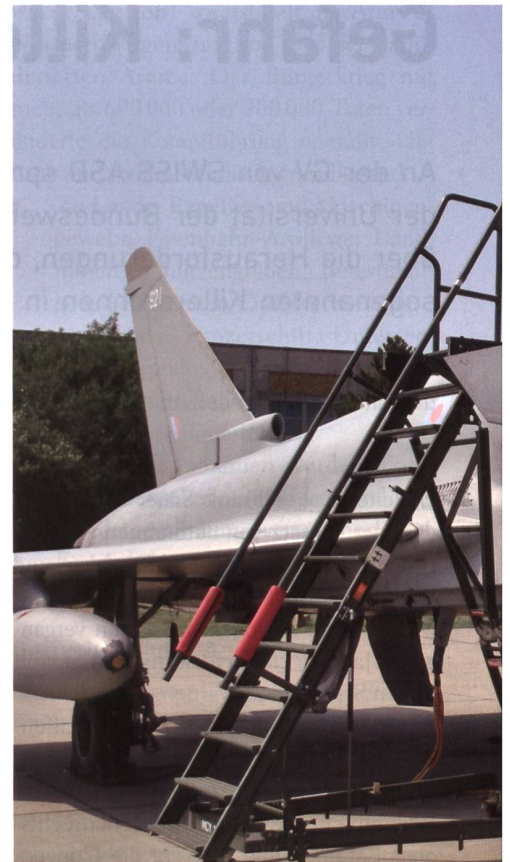
Die vier nach Rumänien gesandten Eurofighter

Der Begleitoffizier der RAF machte gleich zu Beginn klar, dass es angesichts