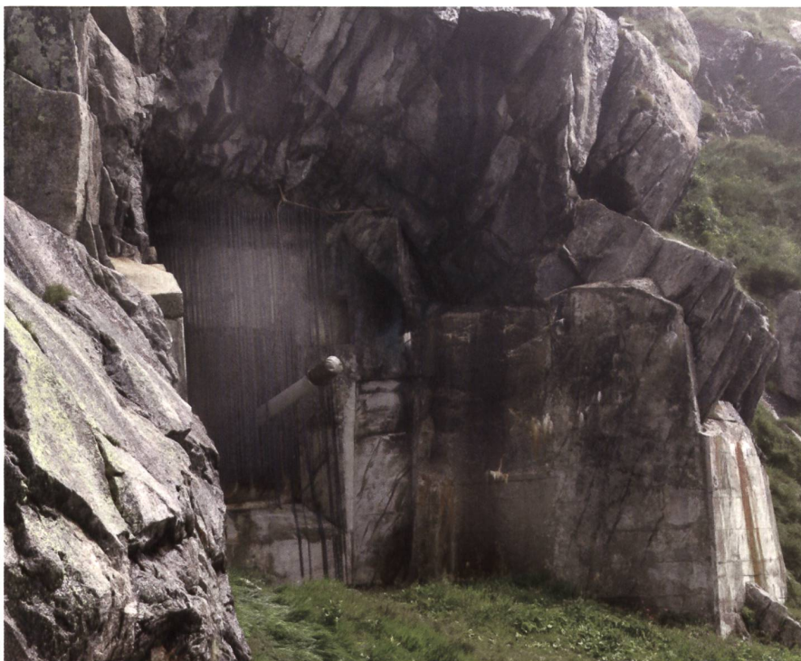
Eine Kanone von aussen.