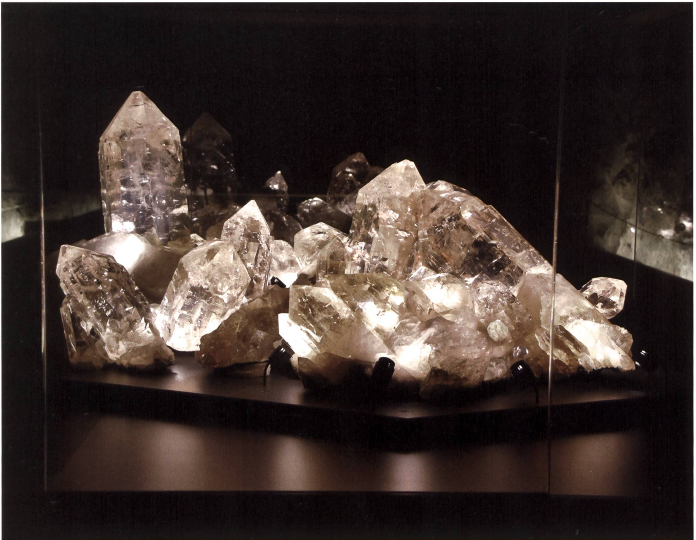
Bilder: Josef Rittler