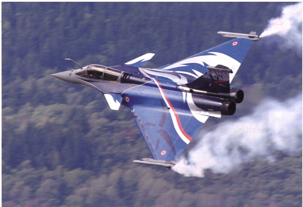
Noch einmal Nationalfarben: Der französische Rafale von Dassault. Ein Spitzenjet.

Die weltberühmten Frecce Tricolori der italienischen Luftwaffe malen ihre drei Nationalfarben in den Himmel über Sion.