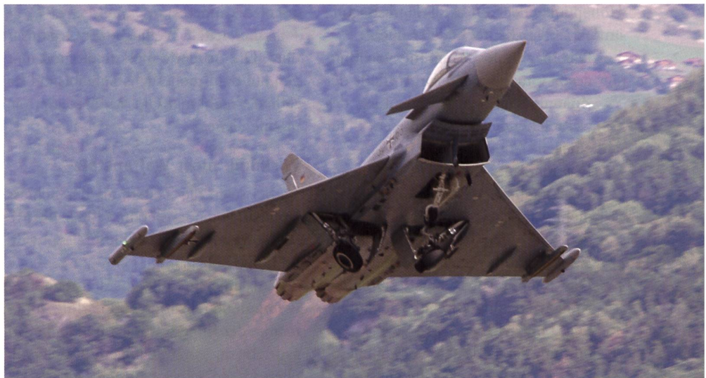
Weltklasse. Der Schweizer Cheftestpilot Geri Krähenbühl fliegt den Eurofighter.