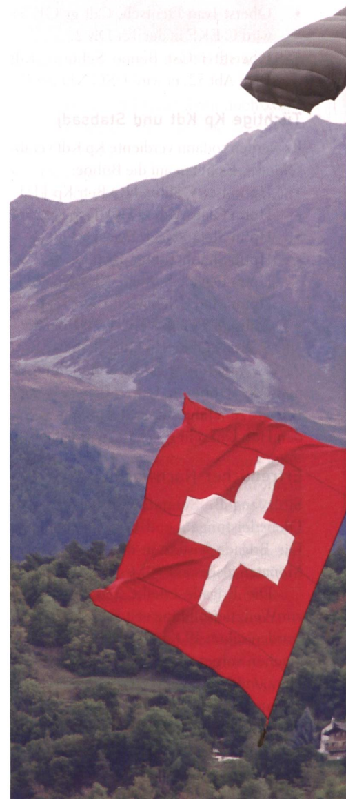
Das gehört zu jeder Flugschau: Die formidablen