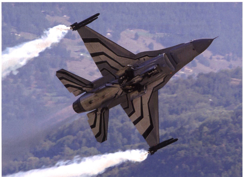
Eine atemberaubende Flugvorführung: Belgischer F-16 vor Walliser Hintergrund.