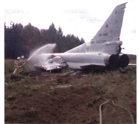
Flugplatzfeuerwehr löscht Tu-22.