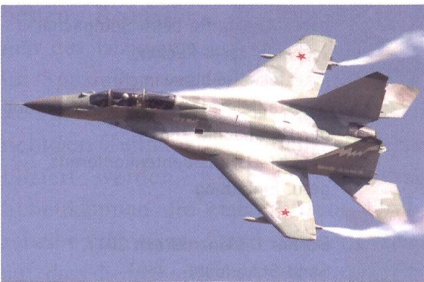
Beginn der Flugversuche der MiG-29M2.

In Russland ist mit der Erprobung der ersten beiden für Ägypten bestimmten Kampflugzeuge Mikojan MiG-29M/M2 (auch MiG-35) begonnen worden. Der Vertrag über 50 Maschinen aus dem Jahr 2016 hat einen Wert von 2 Milliarden Dollar. Noch in diesem Jahr soll das erste Exemplar aus-