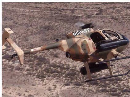
Beobachtungs- und Kampfhelikopter MD 530F für Afghanistan.

Das US-Verteidigungsministerium hat bei MD Helicopters einen Grossauftrag über 150 MD 530F Cayuse Warrior platziert. Es handelt sich dabei um einen Festauftrag, die ersten 30 Helikopter sollen laut einer Presseaussendung des Pentagons an die afghanischen Luftstreitkräfte ausgeliefert werden. In der Meldung ist nicht eindeutig erkennbar, ob die restlichen 120