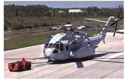
Vorserienauftrag für CH-53K erteilt.

Anfang September bestätigte das US-amerikanische Verteidigungsministerium einen ersten Auftrag für den neuen CH-53K King Stallion Grosshelikopter. Der erste Vorserienauftrag für zwei CH-53K King Stallion entspricht einem Festpreis von 303,974 Millionen US Dollar; es handelt sich dabei um das Low-Rate Initial Production LOT I. Neben zwei Helikoptern sind in dem Vertrag auch Ersatzteile, die Wartungslogistik und andere Dienst-