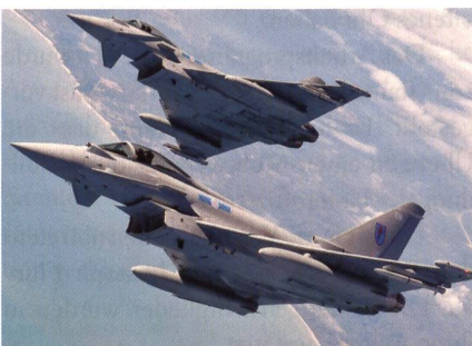
Katar will 24 Eurofighter beschaffen.

Das Abkommen sei nach mehrjährigen Verhandlungen zustande gekommen, teilte das britische Verteidigungsministerium anlässlich eines Besuchs des britischen Verteidigungsministers in Katar mit. Katar hat im Mai 2015 bereits 24 französische Rafale Kampflugzeuge in Auftrag ge-