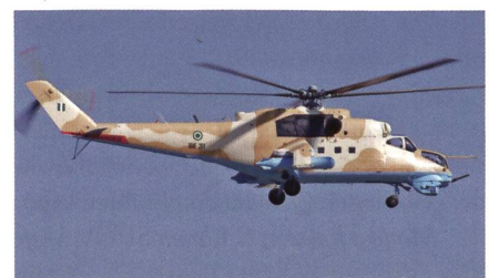
Kampfhelikopter Mil Mi-35M für Nigeria.

Im Rahmen der Festlichkeiten anlässlich des 53. Jahrestages der Gründung der nigerianischen Luftwaffe wurden die ersten beiden Kampfhelikopter Mil Mi-35M offiziell in Dienst gestellt. Die Helikopter waren bereits zu Jahresbeginn ausgeliefert wor-