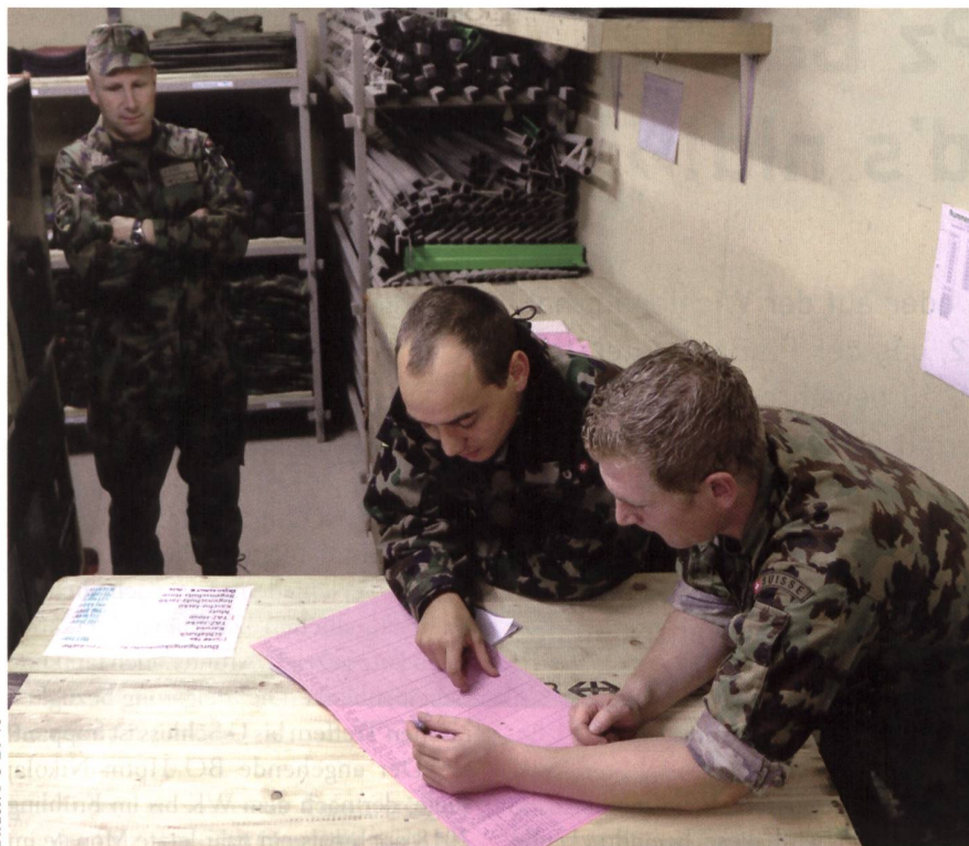
Bilder: FU Br 41

Erste Schritte als Inspizient unter Aufsicht des Fhr Geh Kdt FU Br 41/SKS.