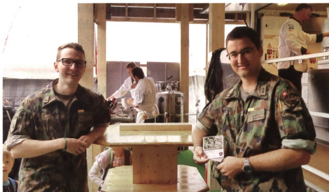
Guter Empfang. Mit Olma-Badge über dem Namensschild.