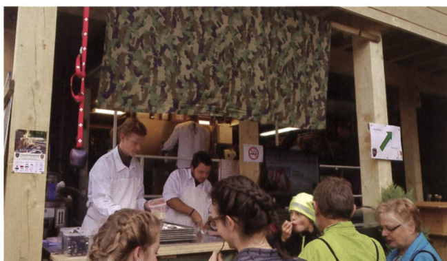
Für das leibliche Wohl sorgen die Militärköche.