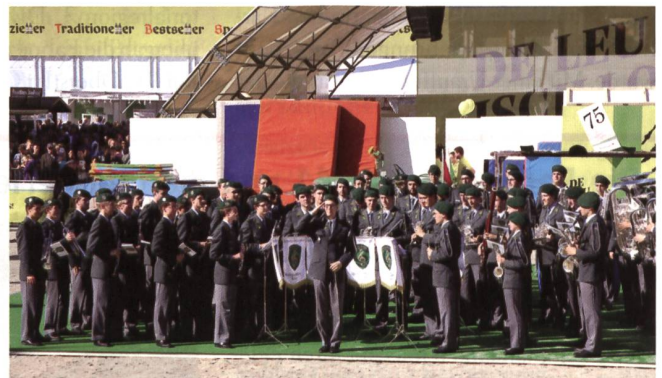
Rassige Militärmusik an der Olma 2017.