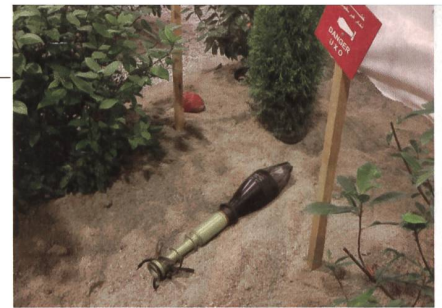
Achtung! Lebensgefährliches Geschoss!