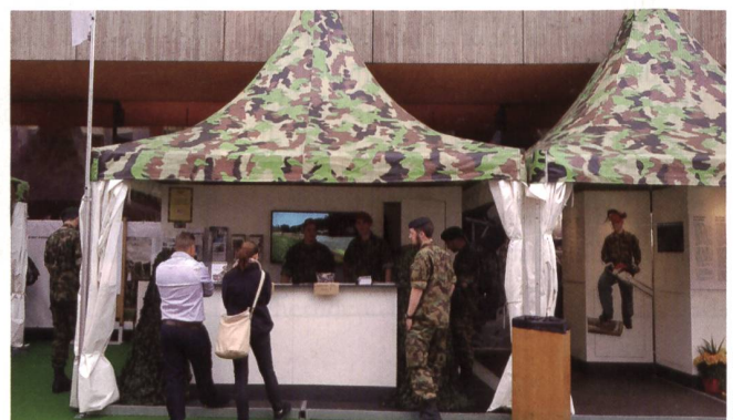
Attraktive Stände ziehen zivile und militärische Gäste an.