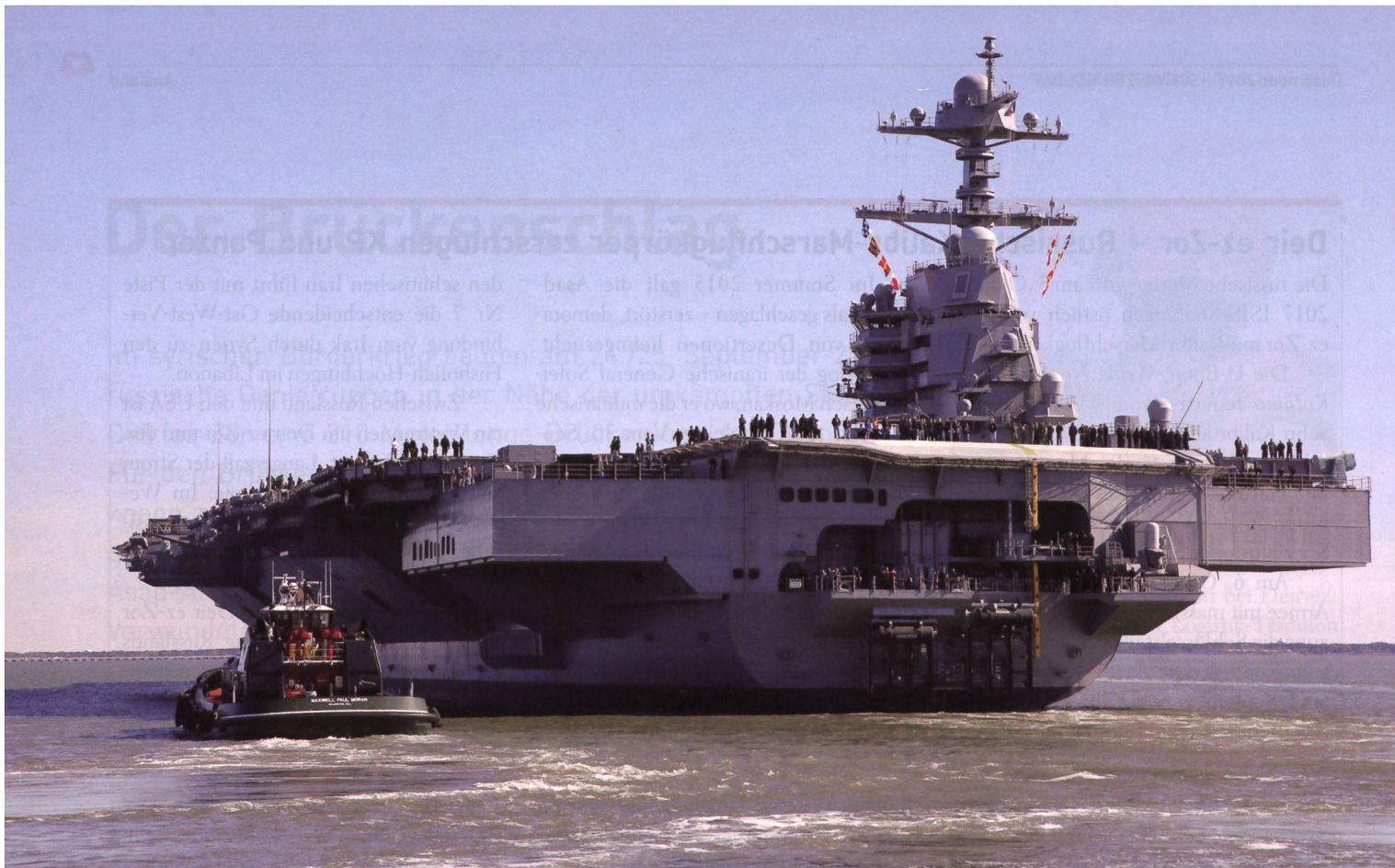
Die Ansicht von achtern der neuen Ford zeigt die neuen Konturen der Insel und den nach hinten versetzten Turm, zudem sind am Heck steuerbords und backbords neue ausladende Zellen eingebaut.