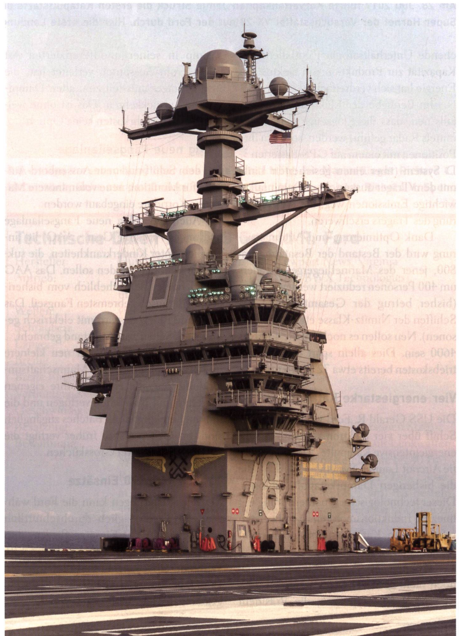
Der Kommandoturm der Ford unterscheidet sich von Inseln früherer Träger. Er ist kleiner, abgeschrägt und nach hinten versetzt. Er hat nur einen Mast.

Dies eliminiert die unzähligen Dampfleitungen im Innern des Schiffes, entspre-