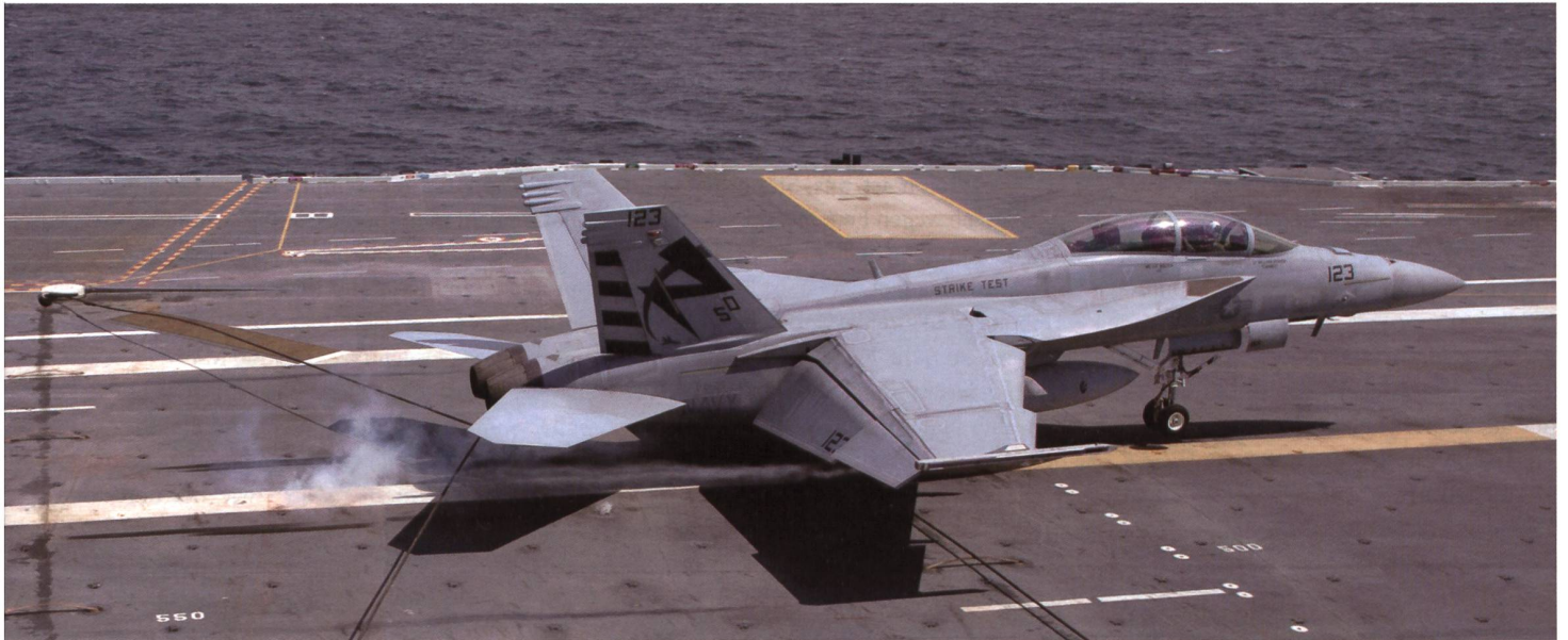
Am 28. Juli 2017 führte Korvettenkapitän Jamie Struck die ersten Katapultstarts und Fangseillandungen mit einer F/A-18F Super Hornet der Versuchsstaffel VX-23 auf der Ford durch. Hier die erste Landung am Fangseil Nr. 2.

chende Unterhaltsarbeiten entfallen. Die Kapazität zur Produktion von elektrischer Energie hat sich verdreifacht.