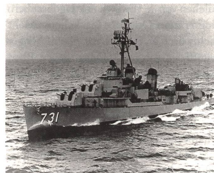
Die USS Maddox (DD 731) befand sich am 2. August 1964 vor der Küste von Nordvietnam, als sie angegriffen wurde.

F-8E-Crusader über dem Golf von Tonkin und in der Nähe der beiden Zerstörer geflogen. Um 18.30 Uhr kehrte er vom zweiten Einsatz zur Ticonderoga zurück.