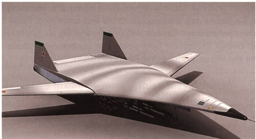
Der Fernbomber PAK DA ersetzt die strategischen Bomber Tu-95 und Tu-160.

Konowalow: «Die neuartige Maschine wird jetzt planmässig entwickelt. Der Jungfernflug ist für 2020/2021 geplant. Dann wird das Flugzeug nach mehreren Tests an die Luftwaffe ausgeliefert», sagte der General. PAK DA soll spätestens 2015 alle strategischen Bomber der Typen Tu-96 und Tu-160 sowie zum Teil auch Tu-22M3 ersetzen.