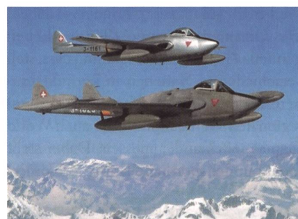
Sozusagen aus der Urzeit der Jet-Fliegerei: Die Briten Venom und Vampire.