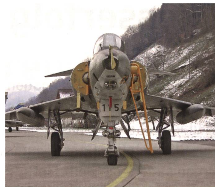
Mit dem Ende der Mirage-III-RS gingen Fähigkeiten zur Aufklärung verloren.