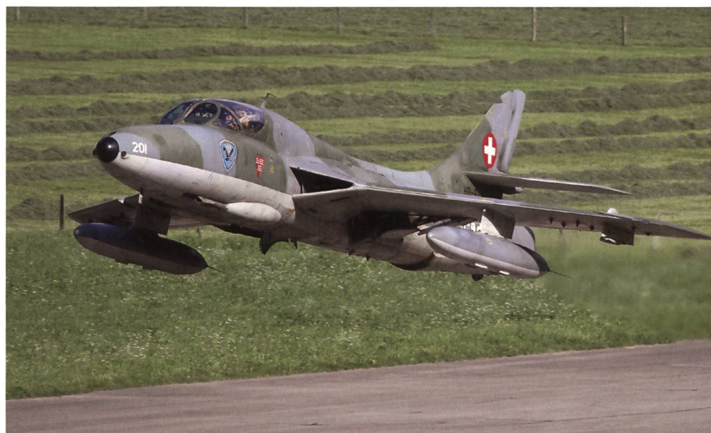
Schweizer Hunter startet in den Alpen.