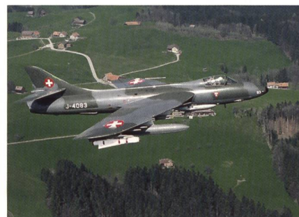
J-4083. Als die Hunter ausschieden, war es vorbei mit dem Erdkampf.