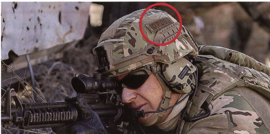
Wie wichtig die Blutgruppe ist, zeigt die moderne Lösung: Angaben auf dem Helm.