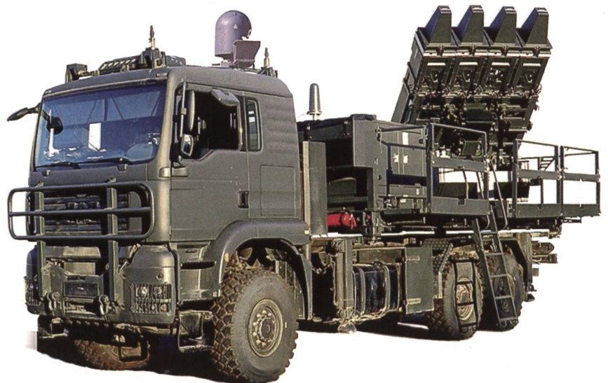
Spyder wurde von den staatlichen Firmen Rafael (Haifa) und IAI (Tel Aviv) gebaut.

Demgegenüber reichte Rafael aus Haifa ein Angebot ein, das in den Worten eines Beteiligten «jenseits von Gut und Böse» lag. Schon aus finanziellen Gründen sei es unmöglich gewesen, Spyder-MR weiter zu verfolgen.