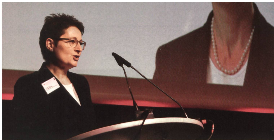
Regierungsrätin Franziska Roth: «27 militärische Infrastrukturen im Aargau.»