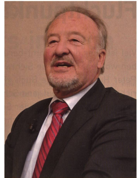
Brigadier Walter Gieringer.

Katalogisiert werden die zukünftigen Leistungen der Armee in die Bereiche «Permanent, Vorhersehbar und Nicht vor-