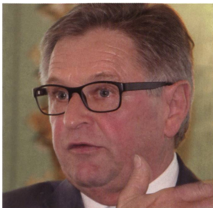
Ständerat Isidor Baumann: Aufgepasst auf Petitionen des Jugendparlaments.

Meier-Deus und Engeli brachten stossende Beispiele, wo die Schweizer Praxis Schweizer Firmen gegenüber der europäischen Konkurrenz benachteiligt. Beide Redner forderten deutsch und deutlich, dass die schwerwiegenden Nachteile aufgehoben werden, damit die hervorragenden Rüstungsfirmen der Schweiz ihre gesetzliche Rolle wahrnehmen können. ☒