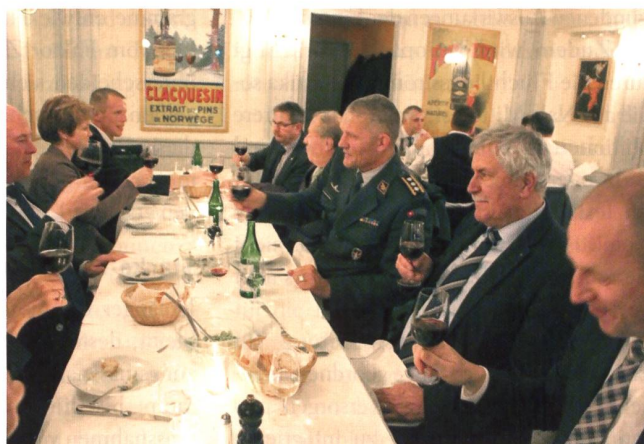
Nachessen im Café Fédéral, dem Bistro am Bundesplatz.