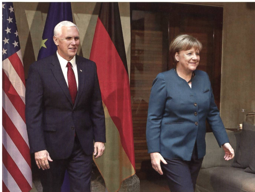
Der amerikanische Vizepräsident Mike Pence und Kanzlerin Angela Merkel.

Vizepräsident Pence, der in München bei seinem ersten grossen internationalen Auftritt als zweiter Mann Amerikas präsidentieller wirkte als sein Präsident, drückte keinen Reset-Button wie sein Vorgänger Joe Biden 2009. Offenbar war es ihm und seinem Team gelungen, aus den bislang widersprüchlichen Signalen seiner Regierung eine klare Botschaft zu formen, die er, so Pence, von Präsident Trump persönlich mitbringe.