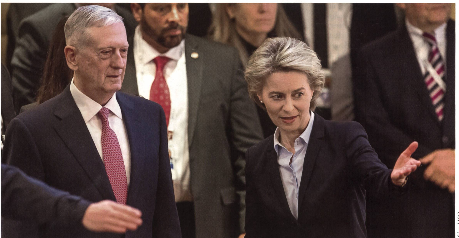
Der amerikanische Verteidigungsminister, General James Mattis, wird von der Deutschen von der Leyen in den Saal geleitet.

Die Bereitschaft zu gestiegenen Rüstungsausgaben verknüpfte von der Leyen schliess-