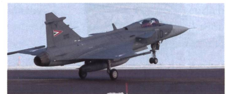
Gripen der ungarischen Luftwaffe.

Ungarn unterhält mit Schweden einen Mietvertrag für 14 Gripen Kampfflugzeuge. Die zwölf Gripen-C-Einsitzer und zwei Gripen-D-Doppelsitzer wurden zwischen 2006 und 2007 an die ungarischen Luftstreitkräfte geliefert und stehen nun seit gut zehn Jahren im Einsatz. Die Mietverträge wurden im Jahr 2012 von 2016 bis