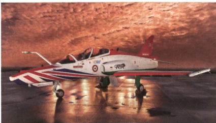
Advanced Hawk von BAE Systems und Hindustan Aeronautics.

Auf der Aero India präsentieren BAE Systems und Hindustan Aeronautics ihren gemeinsam verbesserten Jettrainer Advanced Hawk. An der neuen Ausführung wird mit Firmemitteln seit etwa zwei Jahren gearbeitet. Zu den Verbesserungen zählen aktive Vorflügel und eine adaptierte «Kampfklappe», die in Kombination für mehr Wendigkeit sorgen sollen. Dazu wurde der Schub des Adour-Triebwerks gesteigert. Im Cockpit sind nun sehr grosse Farbdisplays verbaut. Der Advanced Hawk verfügt zu-