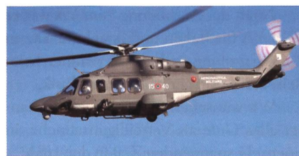
Mehrzweckhelikopter AW 139.

Das pakistanische Verteidigungsministerium hat weitere AW139 bestellt. Sie sollen ab Mitte 2017 geliefert werden. Leonardo nannte bei der Bekanntgabe des neuen Auftrags keine Stückzahlen. Die Mehrzweckhelikopter sollen für Transport und allgemeine Unterstützungsaufgaben ver-