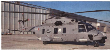
NH90 MITT der italienischen Marine.

Die italienische Marine hat jüngst ihren ersten von zehn NH90 MITT übernommen. Derweil werden die NH90 NFH mit IFF Mode 5 nachgerüstet. Der NH90 MITT (Maritime Italien Navy Tactical Transport) soll für die Unterstützung von amphibischen Operationen und für Einsätze von Spezialkräften genutzt werden. Er verfügt wie die TTH-Version des Heeres über eine