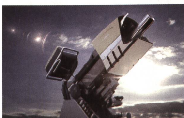
RUAG COBRA Mörsersystem

Das RUAG COBRA 120mm Mörsersystem ist ein Hightech-Produkt, das neue Masstäbe für indirekte Feuersysteme setzt. Ein elektrischer Antrieb und eine halbautomatische Ladevorrichtung sorgen für entscheidende Präzision und Schelligkeit. RUAG COBRA kann einfach auf jedem Rad- oder Kettenfahrzeug montiert werden und ist so ausgelegt, dass die Nutzer das System schon nach kurzer Schulungsdauer versiert einsetzen können.