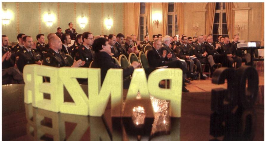
Im stilvollen Empire-Saal des Äusseren Standes in Bern dominiert die Farbe Gelb.