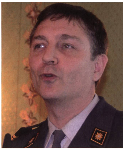
Souverän: Der Präsident Vautravers.