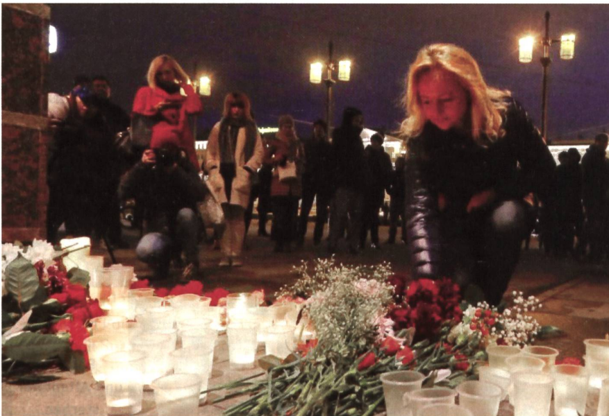
St. Petersburg, 3. April 2017, Metrostation am Technikum: Blumen und Kerzen.

Mehrere Jahre lang blieben Russlands Metropolen vom Terror verschont – bis am 3. April 2017 eine Bombe in der U-Bahn von St. Petersburg 14 Menschen in den Tod riss und 50 verletzte. Ganz in der Nähe fanden Polizisten eine zweite Bombe, die sie entschärften. Präsident Putin befand sich in seiner Geburtsstadt, als die Bombe explodierte, war aber nicht das Ziel.