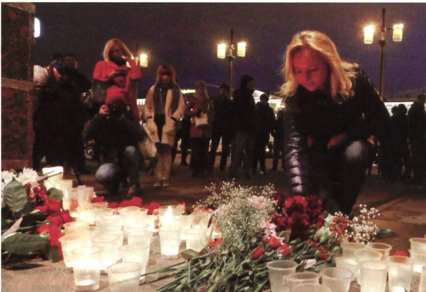
St. Petersburg, 3. April 2017, Metrostation am Technikum: Blumen und Kerzen.

Mehrere Jahre lang blieben Russlands Metropolen vom Terror verschont – bis am 3. April 2017 eine Bombe in der U-Bahn von St. Petersburg 14 Menschen in den Tod riss und 50 verletzte. Ganz in der Nähe fanden Polizisten eine zweite Bombe, die sie entschärften. Präsident Putin befand sich in seiner Geburtsstadt, als die Bombe explodierte, war aber nicht das Ziel.