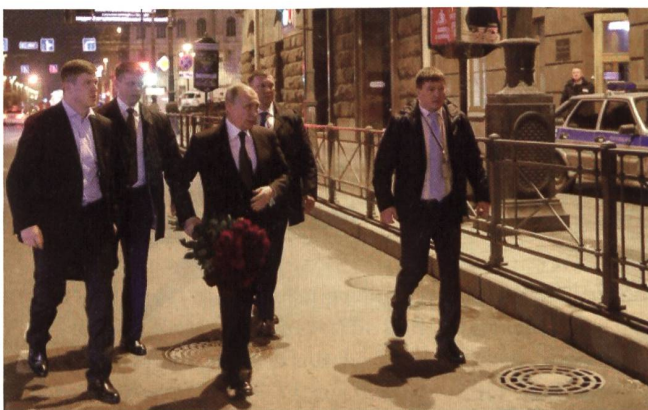
Präsident Putin bringt Blumen zum Tatort am Sennaja-Platz.