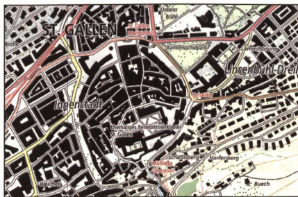
Der Kartenausschnitt St. Gallen...

Der Bedarf an Geodaten mit hoher Genauigkeit nimmt stetig zu. Erstmals wird nun eine neue Landeskarte vollautomatisch jährlich über die gesamte Schweiz erstellt und mit den aktuellsten verfügbaren