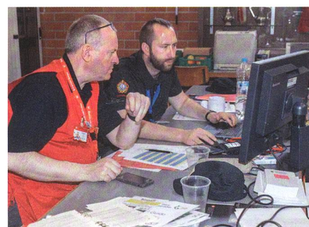
CISM-WM 2018 der Schützen in Thun: Hochbetrieb im Rechnungsbüro.

Die Schweizer Delegation festigt und fördert an CISM-Wettkämpfen das Ansehen der Schweizer Armee im In- und Ausland. Der Grundsatz «Teilnahme kommt vor Rang» gilt auch für den CISM. Für be-