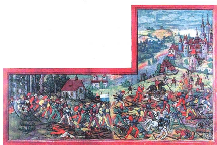
1499: Die Eidgenossen brechen aus dem Wald heraus und stürzen auf die zahlenmässig stärkeren Schwaben.