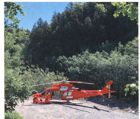
Die REGA ruft zur Kabel-Meldung auf.

Luftfahrthindernisse wie Kabel und Transportseile bedeuten für Helikopter eine grosse Gefahr. Sie können zu schweren Beschädigungen und sogar zum Absturz