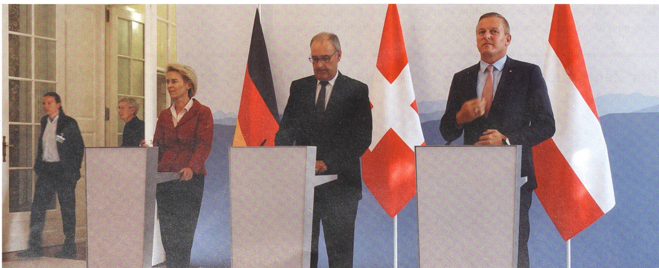
23. August 2018, im Bernerhof. Die Minister von der Leyen (Deutschland), Parmelin (Schweiz) und Kunasek (Österreich).