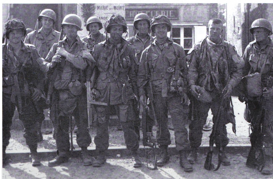
Unschärfes Bild aus der Normandie: Fallschirmjäger der 101. Luftlandedivision.

Präsident Kennedy beförderte ihn zum Generalstabschef der amerikanischen Streitkräfte. Präsident Johnson ernannte ihn zum Botschafter in Saigon, als sich Südvietnam des Vietcong-Ansturms zu erwehren suchte.