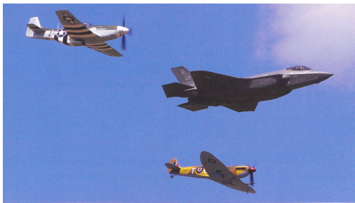
USAF Flight Heritage Formation: P-51D Mustang, F-35A Lightning II, Spitfire.