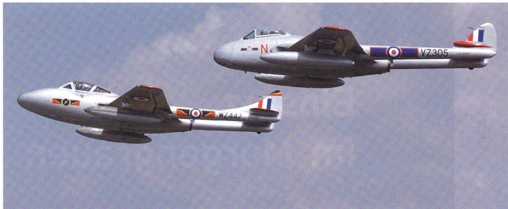
Schweizer Aviatikgeschichte: Links der Vampire-Trainer, der in unserer Luftwaffe als U-1230 bis 1990 flog. Rechts der Vampire-Einsitzer, in der Schweiz J-1196. Derzeit fliegen sie für Norwegen. Zum RAF-Jubiläum in den RAF-Farben!

Der Aderlass über die Jahre war gewaltig. Während die RAF 1978 noch 85 000 Mann und 511 Kampfflugzeuge (28 Staffeln) zählte, sind es heute noch etwa 33 000