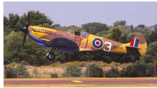
Legendär aus der Luftschlacht über England: die Spitfire.