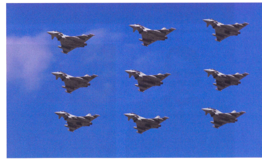
Eine seltene Formation: Neun Eurofighter Typhoon der Royal Air Force.

1937 wurde der erste Tiefdecker-Einsitzer und Jäger, die legendäre Hurricane, in der 111. Staffel in Dienst gestellt. Dem Quantensprung folgte ein Jahr später die ebenso berühmte Spitfire. Bei Kriegsbeginn standen für die Luftverteidigung 35 Staffeln bereit, wovon 22 mit Hurricanes und Spitfires ausgerüstet waren. Die RAF zählte insgesamt etwa 2000 Flugzeuge. Sie sollte in den kommenden Jahren nicht bloss in