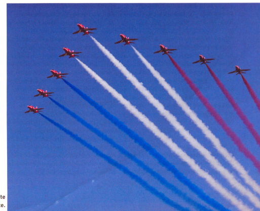
Red Arrows: Die weltberühmte Kunstflugstaffel der Royal Air Force.