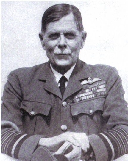
Generalmajor Sir Hugh Trenchard, Royal Air Force 1918.

Europa im Einsatz stehen, ihre Kräfte waren auch im Mittelmeer, in Nordafrika (inkl. Kenya), im Mittleren und Fernen Osten (so Malaya, Singapur) gefordert.