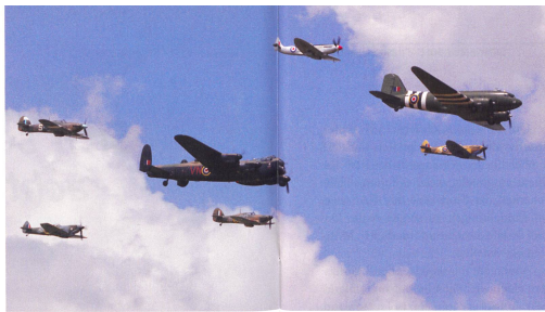
Battle of Britain Formation: Dakota II, Lancastef I, 3 x Spitfire, 2 x Hurricane.