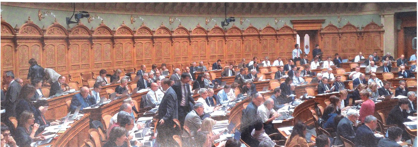
Im Ständerat hatten sich CVP-Politiker für die Rüstungsbranche eingesetzt. Im Nationalrat stimmte die CVP mit der Linken.