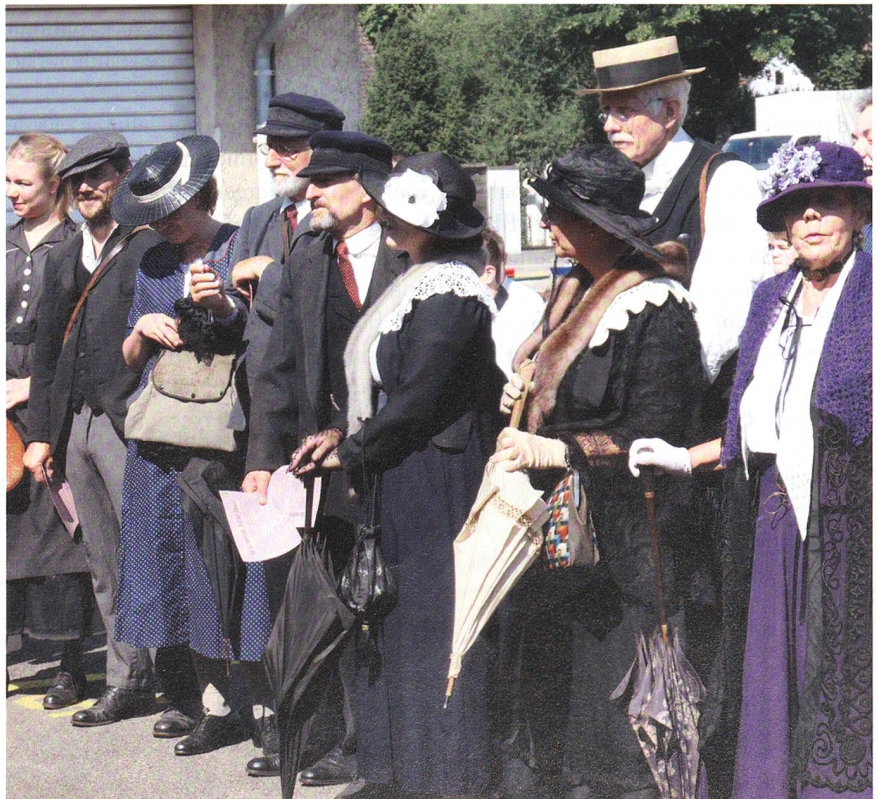
In Schaffhausen inszenierte das Museum im Zeughaus den Landesstreik 1918.

Beachten Sie auch die Analyse von Oberst Fuhrer auf den Seiten 50–53.