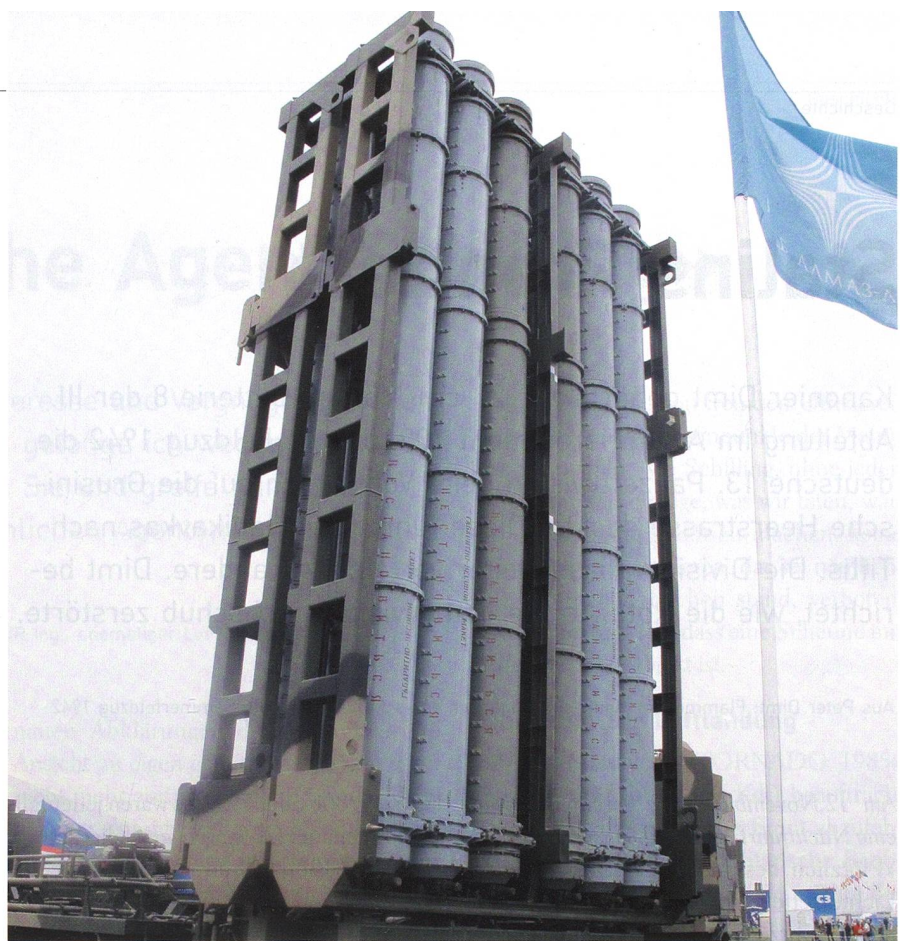
Russlands Fliegerabwehr verfügt seit jeher über höchst schlagkräftige Systeme.

Ebenso wäre es eine offene Kampfansage an die USA, Grossbritannien und Frankreich, deren Kampfjets über Syrien operieren. Im östlichen Mittelmeer kreuzen