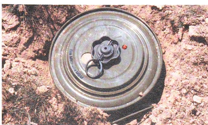
Russische Panzerminen gehören weit verbreitet zu den tückischsten Waffen.