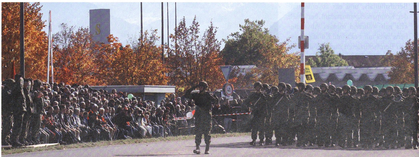
Die Armee präsentiert sich in guter Ordnung. Ihr Rückgrat bilden ihre tüchtigen Unteroffiziere: «Auf Dich kommt es an!»