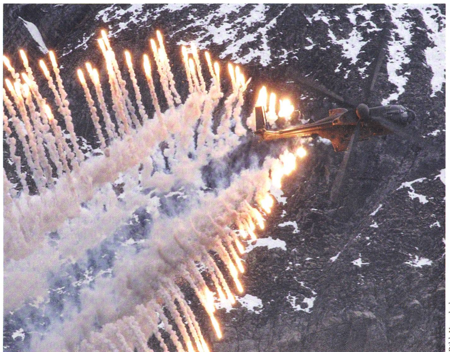
Den LW Na Abt kommt in der Luftwaffe grosse Bedeutung zu. Der Cougar T-340 stösst zum Eigenschutz Flares aus. Flares sind Täuschkörper gegen Lenkwaffen.

Broger findet zu Beginn seines zweiten WK als Kdt präzise Worte: «Unsere Daten tragen dazu bei, dass viele Leute in der Schweiz sicherer sind. Ich erwarte des-