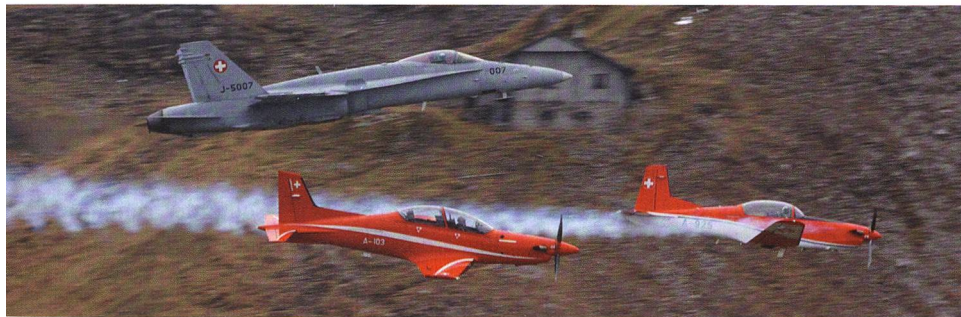
Eine nicht ganz alltägliche Szene: von unten nach oben PC-21, PC-7, F/A-18.