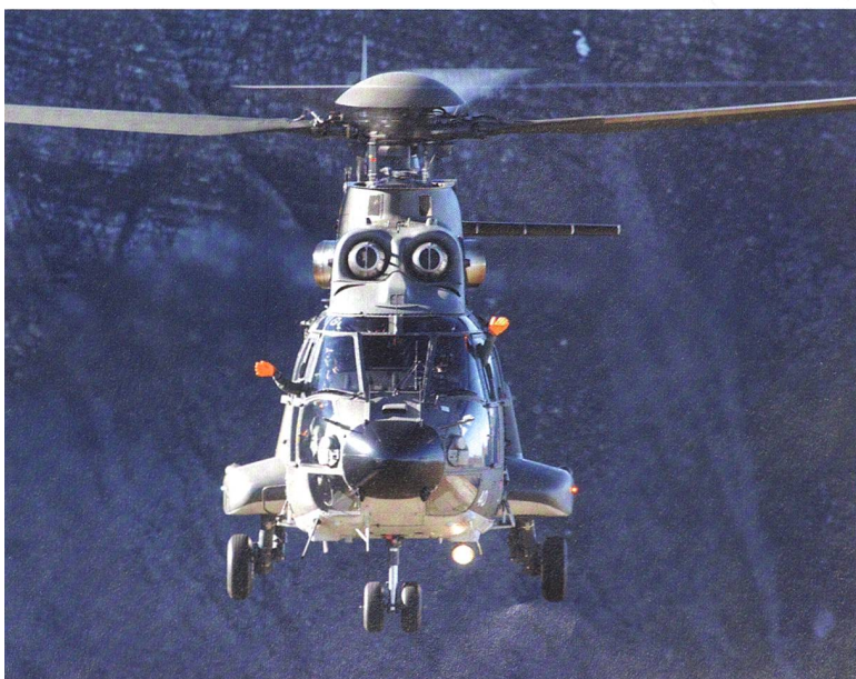
Super Puma: Die Piloten winken mit orangen Handschuhen.