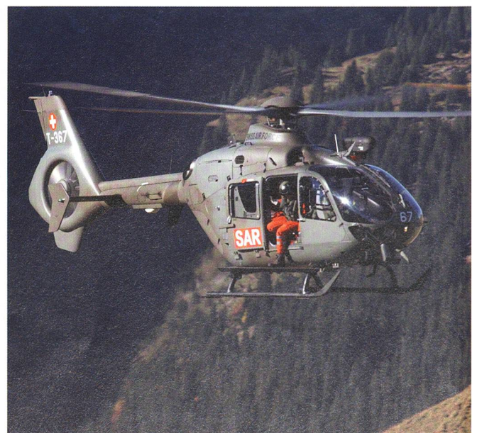
Der EC-635, der neueste Helikopter unserer Luftwaffe.