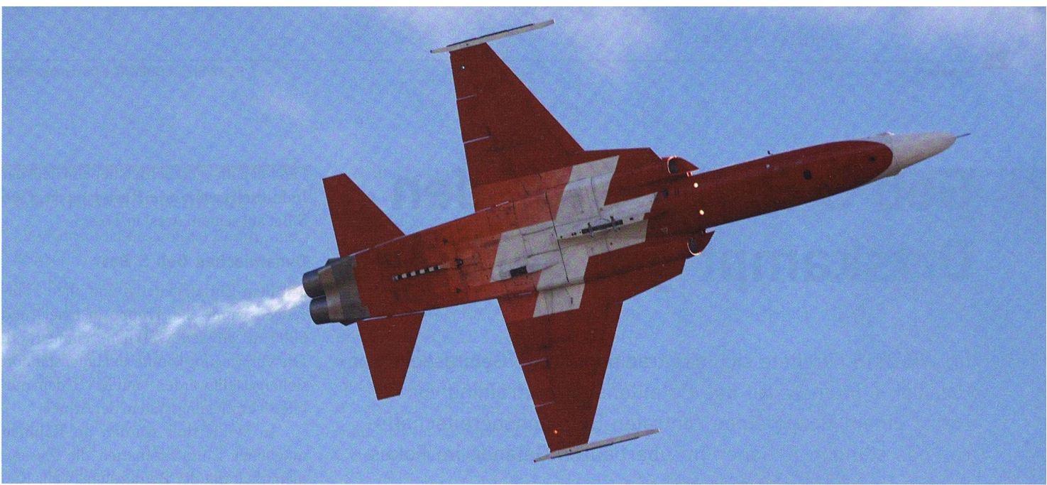
Einen glanzvollen Höhepunkt bilden stets auch die F-5E der Patrouille Suisse (PS), der Stolz der Luftwaffe und der Armee.