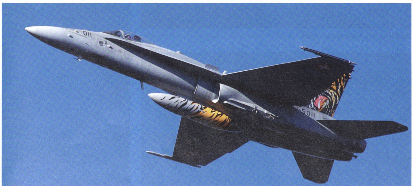
Immer ein Höhepunkt auf der Axalp: der Auftritt der F/A-18. Im Bild die Staffelmachine 5011 der stolzen Fliegerstaffel 11.