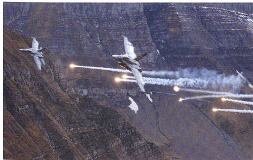
F/A-18-Jets schützen sich mit Flares.