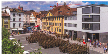
Fahnenabgabe auf dem Neumarkt in Winterthur.