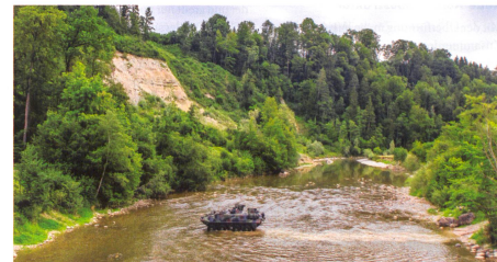
Überwinden des Wasserhindernisses. An der Sitter bei Waldkirch SG.