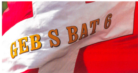
Die Fahne des ältesten Bataillons.