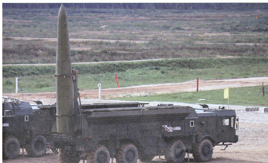
Die Iskander kommt auf dem geländegängigen MZKT-7930. Das System ist hochmobil. Die Reaktionszeit vom Anhalten bis zum Raketenstart beträgt 16 Minuten.