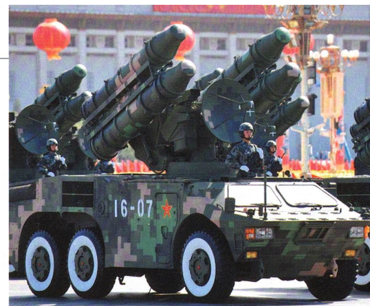
Das 2. Artilleriekorps der Chinesen.

Die DF-21 (NATO CSS-5) und DF-31 (CSS-9) sind schnell und dank endphasengelenkten Gefechtsköpfen sehr präzis. Für die Träger sind die DF-21 besonders im Südchinesischen Meer eine Gefahr. Als ballistische Waffen sind sie schwer zu bekämpfen. Oberst i Gst Jürg Kürsener, unser Marinefachmann, teilt die amerikanischen Bedenken. Wohl trieben die USA die Abwehr voran; und die Träger seien un-