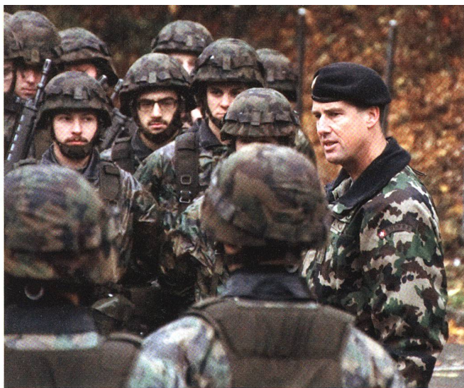
Inspektion bei strömendem Regen.