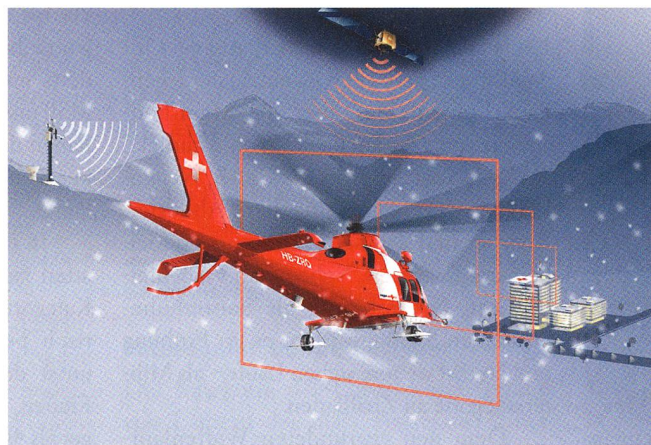
Die Rega flog bei schlechter Sicht über den Gotthard.

«Die Inbetriebnahme des LFN ist für alle Partner ein grosser Schritt und zeigt, dass wir auf dem richtigen Weg sind. In der nächsten Phase sollen weitere Spitäler und Regionen, wie das Engadin, an das LFN angeschlossen werden.»