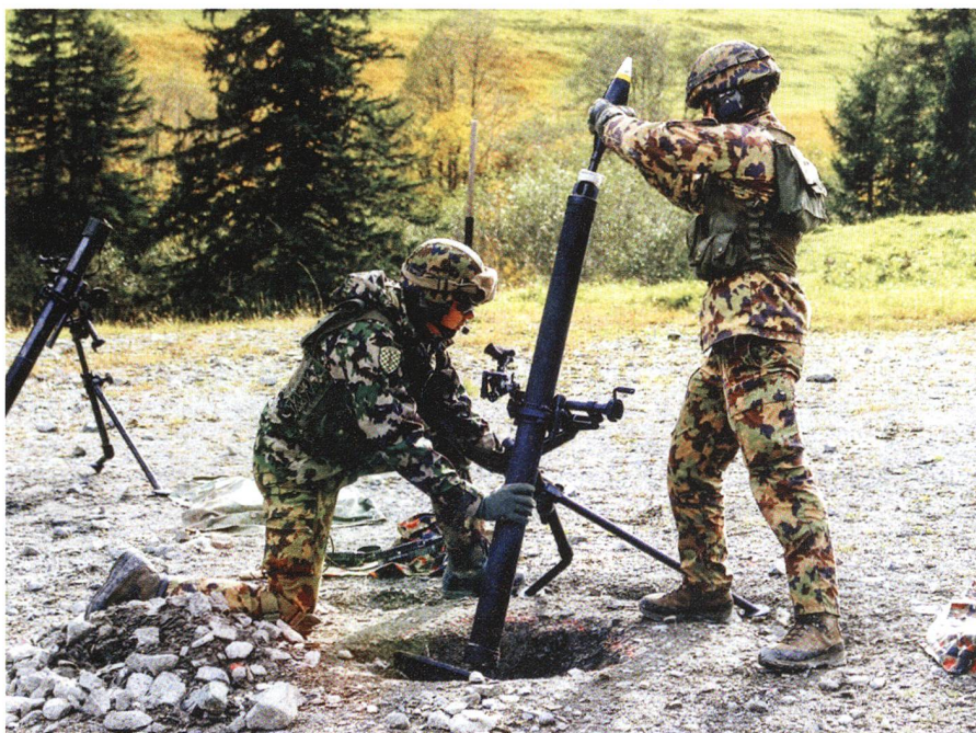
Die Granate wird ins Rohr eines der beiden getesteten Mörser eingeführt.

Gemäss dem Bericht von Lea Ryf im Magazin Armafolio von Armasuisse