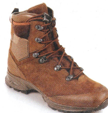
Kampfstiefel komplett in Rauleder. Daneben zeigt Armafolio die Kombination von Textil und Rauleder.