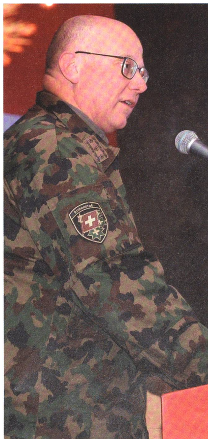
Der CdA dankt dem Kontingent für das grosse Engagement.

Die Herausforderungen sind vielschichtig. Patrouillengänge und Gespräche mit Behörden oder Privaten wollen sorgfältig geplant, durchgeführt und rapportiert sein. Die Vertrauensbasis ist vorhanden, und