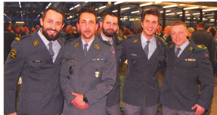
Es lebe die Infanterie mit ihrem Lehrverband und allen Waffenplätzen.