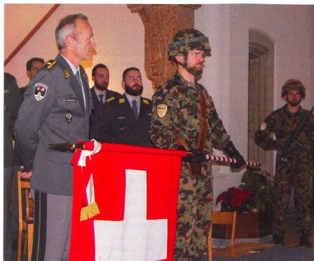
Br Niederberger und der Fähnrich sind zur Brevetierung bereit.