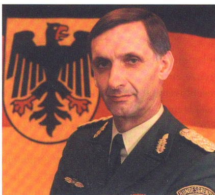
Ulrich Wegener als General des BGS.

Ulrich Klaus Wegener kam am 22. August 1929 im brandenburgischen Jüterbog zur Welt. Sein Vater war Reichswehr-Offizier.