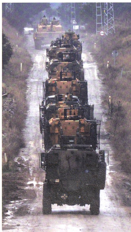
Die türkischen Streitkräfte marschieren in Syrien ein.

tigen Gefallene und Verwundete auch in der Stadt Afrin – ein Beleg für den Umstand, dass Türken dort kämpfen.