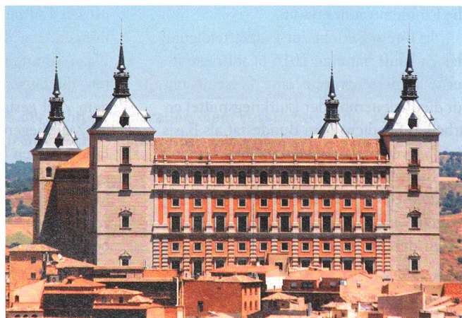
Prachtvolle Fassade. Gut zu erkennen auch die vier Türme.