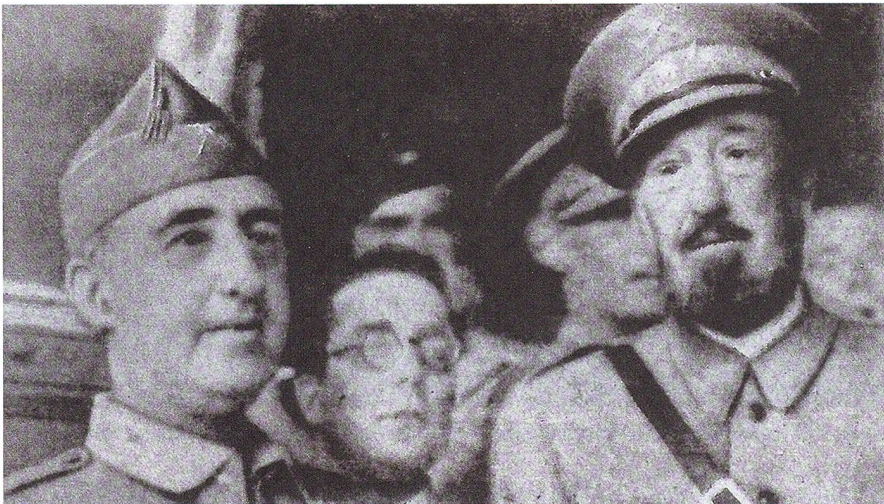
Nach der Befreiung: General Franco, der unbekannte Artur Portela und rechts Oberst Moscardo. Leider sind aus der Belagerung nur unscharfe Bilder vorhanden.

erbsen, 181 Pfund Blumenkohl, 544 Pfund Erbsen, 137 Pfund Artischocken, 54 Pfund Kaffee, 454 Pfund Zucker, 245 Pfund Marmelade, 245 Pfund Tomaten, 40 Stück getrockneter Dorsch, 227 Pfund Lachs, 1425 Liter Olivenöl, 50 Dosen Kondensmilch, 125 Flaschen Apfelwein, 80 Flaschen Tafelwein, 800 kleine Flaschen Wermut, zwölf Flaschen Champagner.