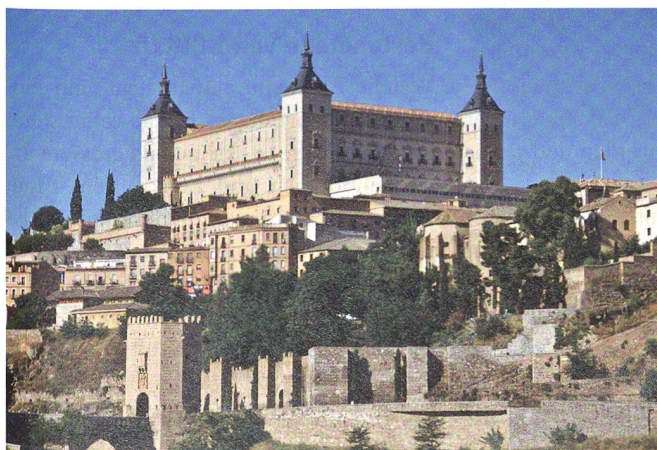
Der von Franco restituierte Alcazar beherrscht Toledo.

Die Szene wurde am nächsten Tag für die Reporter wiederholt, als Franco eintraf. Als Retter des Alcázar wurde er am 1. Oktober 1936 von den Generälen zum Caudillo erhoben. Den tapferen José Moscardo beförderte Franco zum General. ✝