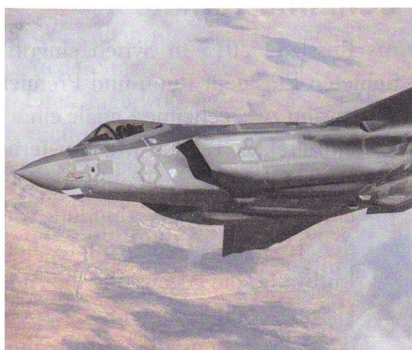
Israels F-35-I Adir (der Mächtige).

Eine offizielle Antwort fehlt. Israelische Beobachter halten fest: