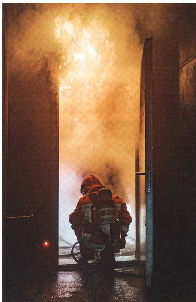
Flashover: Beim Öffnen der Türe wird durch die Sauerstoffzufuhr ein Deckenbrand entfacht.

Hier zündet der Ausbildner per Knopfdruck verschiedene Brandherde. Zuerst gilt es, einen Küchenbrand zu löschen. Dann öffnen die Soldaten eine Türe und werden überrascht von einem «Flashover» Brand – einem Deckenbrand, der durch die frische Sauerstoffzufuhr erst so richtig entfacht. Der nächste Raum.