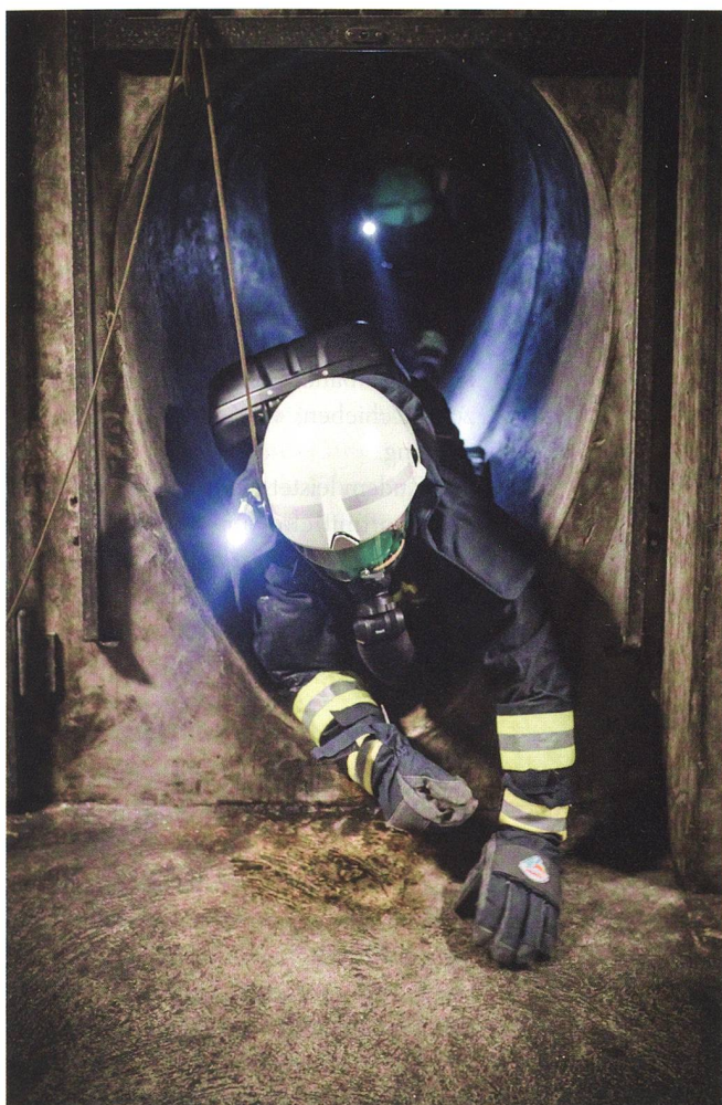
Im engen Kaltstollen gilt es, sich während dem Einsatz an die Atmung mit dem KG 16 zu gewöhnen.