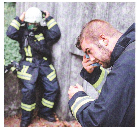
Die Werkschutzsoldaten kommen beim Einsatz an ihre Grenzen.