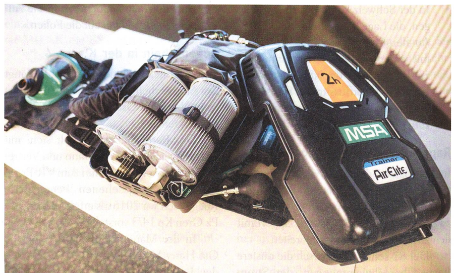
Das Kreislaufgerät 16 versorgt den Anwender mit bis zu vier Stunden Sauerstoff.