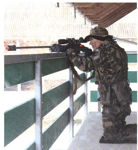
Scharfschütze (Kp 65/4). Mit den Mörsern gehören Scharfschützen zur 4. Kp.