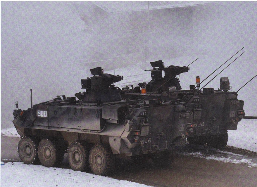
Pulverdampf und Schneetreiben: Zwei Piranha schützen mit ihren MG die Flanke.

Aus Bure berichtet Major Adrian Rüst, Ter Div 4, über die VTU «FANTASSIN» des Inf Bat 61