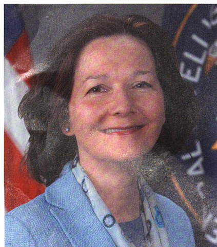
Gina Haspel, Ex-Agentin, Nr. 2 der CIA.