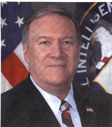
CIA-Chef Pompeo, Trumps Protégé.

Klar zeichnet sich ab: Trump verbindet seine Verteidigungspolitik ungeniert mit dem Handelskrieg, den er mit der Ankündigung von Strafzöllen auf Stahl- und Aluminium-Einfuhren vom Zaun brach. Nachdem er Tillerson entlassen hatte, verknüpfte er an einem Sponsorenanlass in Missouri Streitkräfte und Wirtschaft offen: